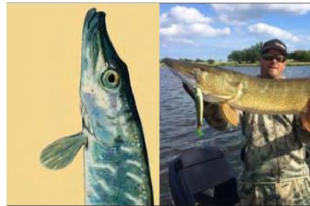
6 - GEDDEFISKERI I Havneløbet og Bugten

Væsentlighedsvurderingen skal beskrive alle oven nævnte aktiviteter. Det gør den ikke.