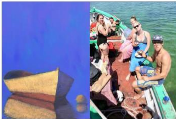
5 - LYSTBÅDHAVNEN Udlejning af kajak, både, surf etc.

bl.a. "Udlejning af kajak, både, surf etc. og geddefiskeri." s. 24. og "Vandsport - joller, kajaker, surfboards, fiskeri, færgebus" s. 27. (Bilag E)