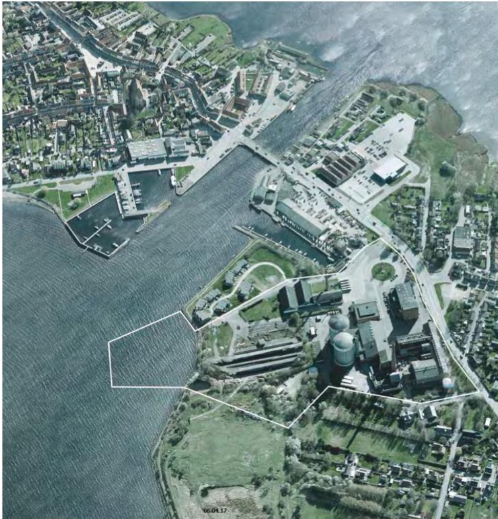
Fugleperspektiv - Sukkerfabrikken, Havnen, Stege Middelalderby.

Fra Sukkerfabrikkens projektprospekt (Bilag E, forlængelse af forsøgstilladelse). Her ser man hvor Pælehusene skal ligge i Vildtreservatet, ved havneløbet med Stege Nor på den anden side af broen.