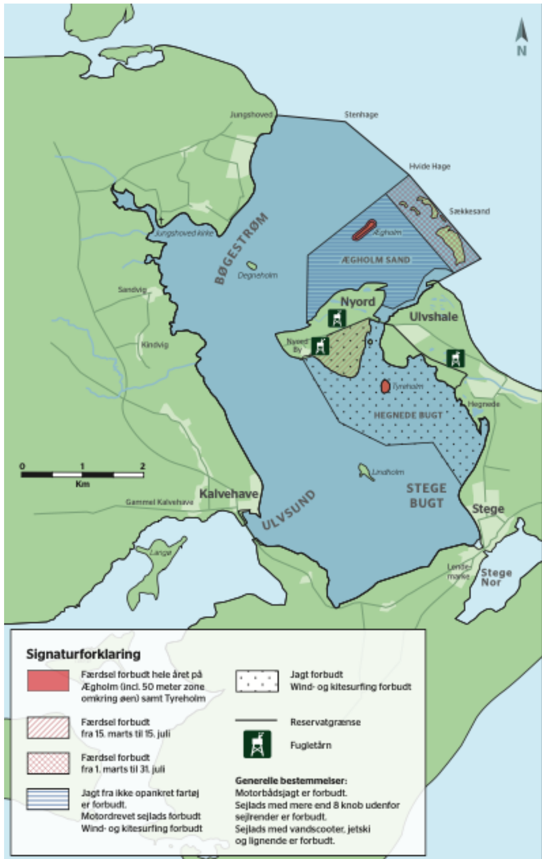
Ulvshale-Nyord Vildtreservat. Miljøstyrelsen.