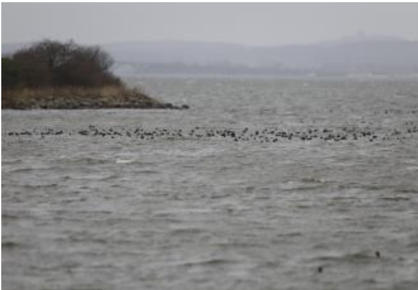
Blishøns i projektområdet. Vinteren 2022.

NIRAS' præmis ville forudsætte, at hele projektet skulle omdefineres, så der kun var aktiviteter på land, og vandområderne gjort sværttilgængelige f.eks. ved at sløjfe alle forøgningsmuligheder, kajakaktiviteter og andre incitamenter til "blå turisme". Prospektmaterialet skulle dermed revideres gennemgribende. Men så ville projektet ikke længere opfylde Forsøgstilladelsens forreste betingelse, at det skal være "projekter med potentiale for udvikling af kyst-og naturturismen" .