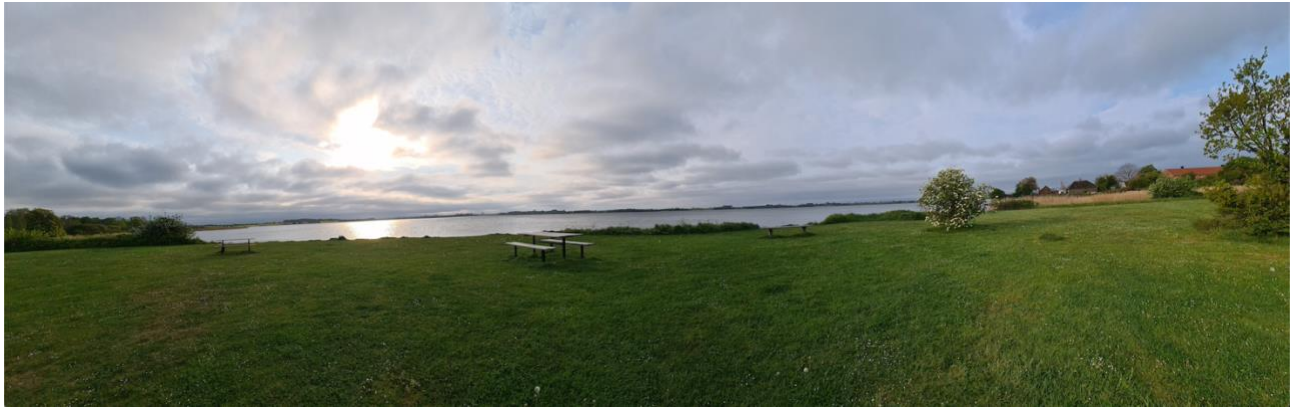
Rosengårdshaven 16.5. 2023. Ingen bro opsat!